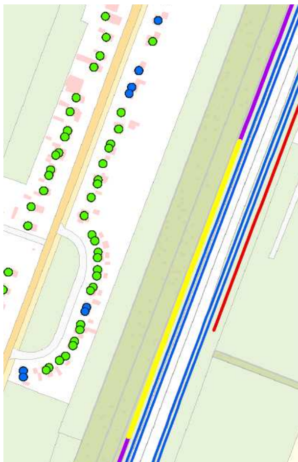
Geluidseffecten scherm op tweede verdieping in Hollandsche Rading,

Er is besloten om twee geluidsschermen aan te passen: Het geluidsscherm bij Hollandsche Rading (aan de westzijde van de snelweg) zal verhoogd worden van 3 naar 4 meter.